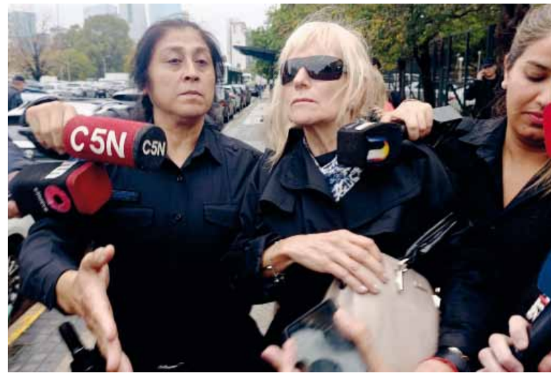
En Tribunales. En la causa ya declararon las cuatro mujeres que le prestaron dinero a Adorni.

En cuanto a las declaraciones de Sbabo y Viegas, el fiscal Gerardo Pollicita terminó de escuchar a las cuatro mujeres que le prestaron