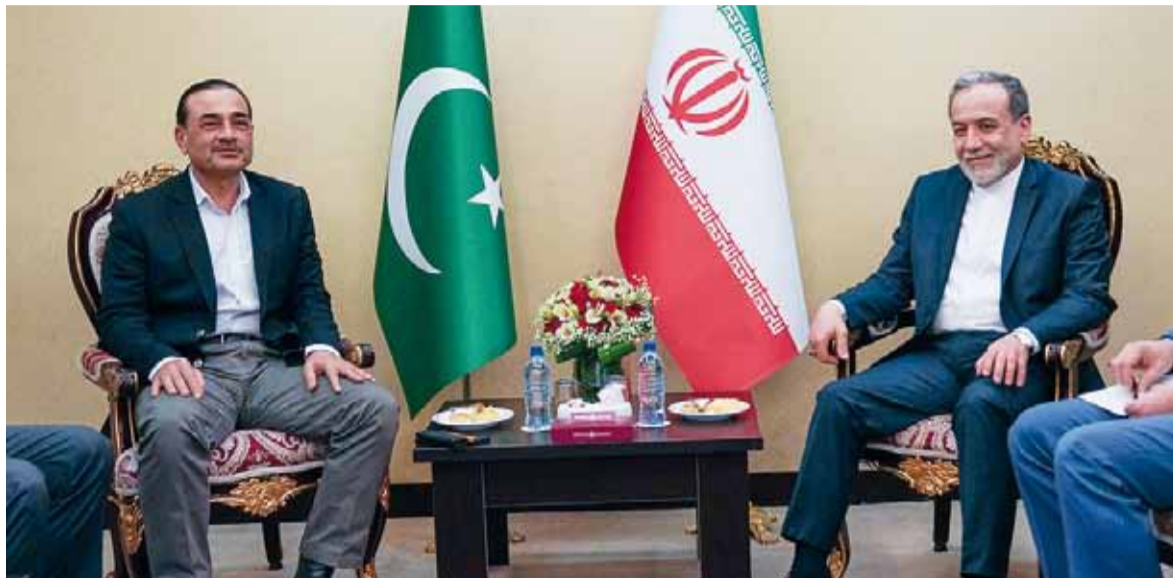
Conflicto. Persisten fuertes diferencias por el programa nuclear iraní y el control del estrecho de Ormuz.

El eje de la disputa sigue siendo el programa nuclear iraní y el bloqueo marítimo impuesto por Estados Unidos. Desde Washington, el presidente Donald Trump volvió a presionar por la reapertura total del estrecho de Ormuz, un