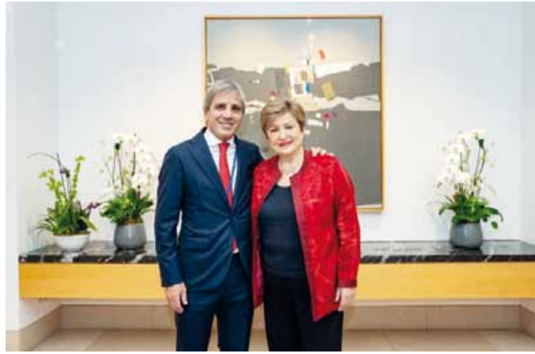
Reencuentro. Caputo junto a la titular del FMI, Georgieva.

Caputo comunicó en sus redes sociales que el FMI aprobó la segunda revisión del acuerdo por US$ 20.000 millones, el cual le permitirá recibir un desembolso de US$ 1.000 millones. Según el