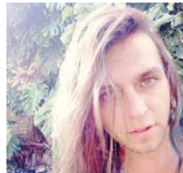
La víctima era oriunda de Tucumán.

Con el análisis de cámaras de seguridad, testimonios y peritajes forenses, la causa avanzó en las últimas horas. Como resultado