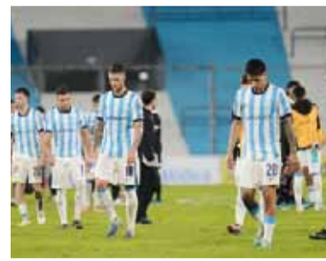
Sobre el final. Llegó el gol de los brasileños para el 3 a 2.

Racing empezó ganando casi desde el inicio del encuentro y lo