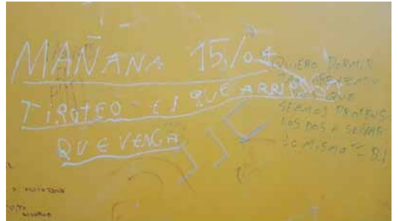
Amenaza. La inscripción hallada en un colegio de Villa Elisa.

Aparecieron carteles y pintadas intimidatorias en distintos distritos de la provincia con amenazas de supuestos ataques. Dicen que son "desafíos de TikTok".