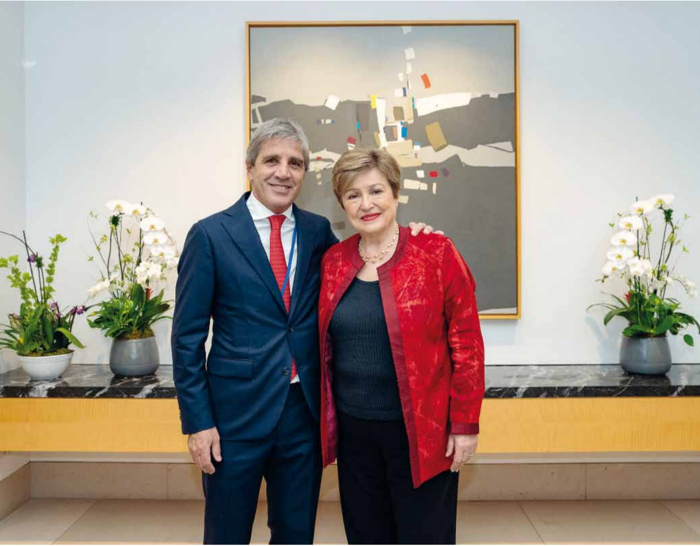
El ministro de Economía, Luis Caputo, agradeció a la titular del Fondo, Kristalina Georgieva, "por su liderazgo y compromiso".