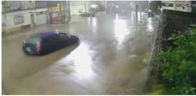
Desastre. En Dock Sud las calles quedaron inundadas.

En el Gran Buenos Aires, Avellaneda fue uno de los distritos más castigados. La avenida Hipó-